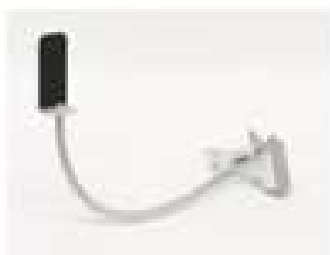
B302ABS フレキシブルアーム式 固定具 (標準付属品)