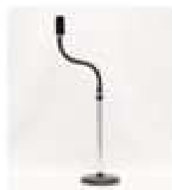
SC-200 固定ポール (オプション)